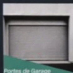
Portes de Garage